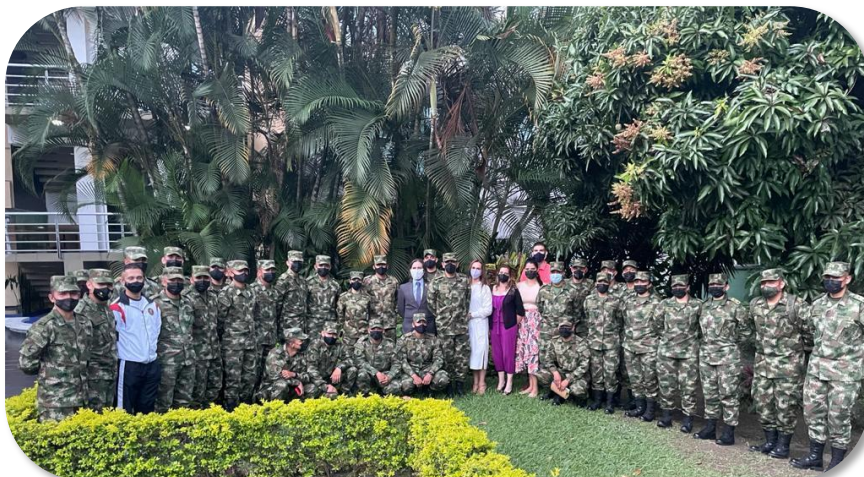
Grupo de conferencistas y asistentes al Primer Seminario en Experiencias de Liderazgo