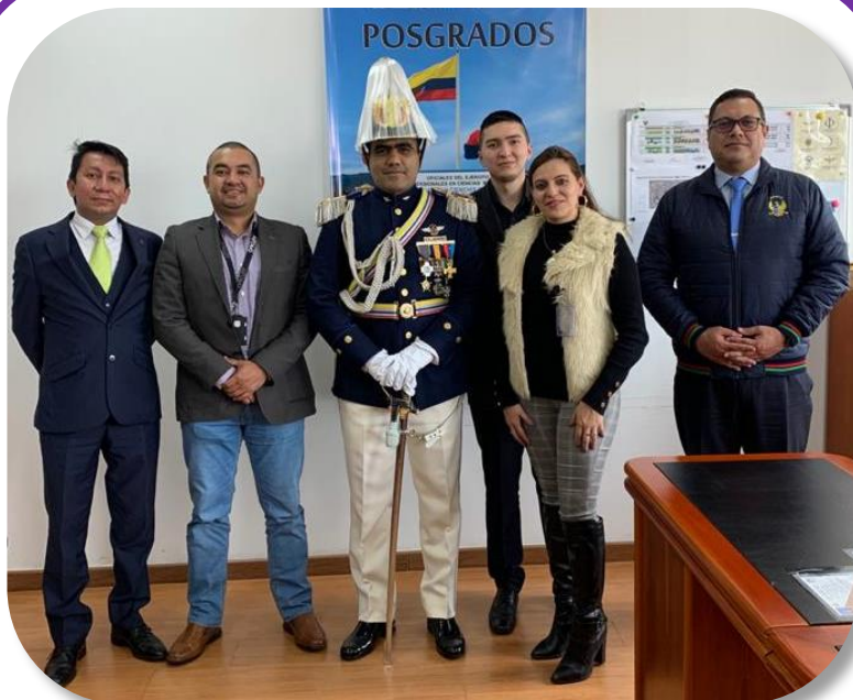
Equipo académico - administrativo de la Facultad de Posgrados