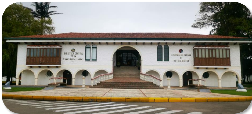
Biblioteca Central de las FFAA Tomás Rueda Vargas y Academia Colombiana de Historia Militar – Escuela Militar de Cadetes General José María Córdova