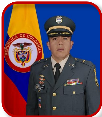
Mayor BRAYMER SINAY VELASQUEZ CARRILLO

«El corazón Como dijo Heráclito: «no hay nada permanente, excepto el cambio». Y es cierto que la vida cambia constantemente, queramos que lo haga, o no.