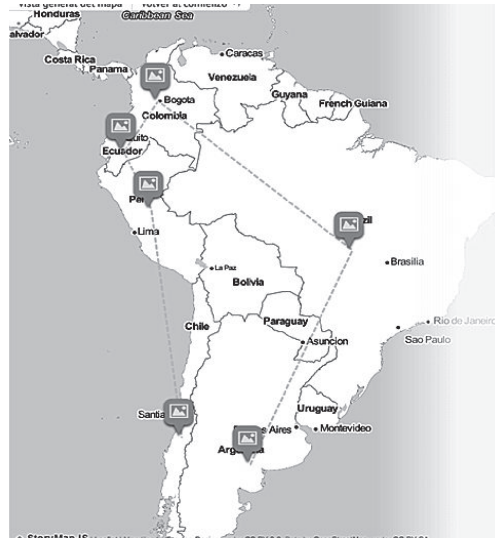
FIGURA 2. PAÍSES de la región con mayor flujo de migrantes venezolanos.

Entre los años 2015 y 2017, la migración venezolana en la región ha crecido en más del 900% y en casi todo el mundo se extendió en un 110 %, siendo estas cifras alarmantes, porque demuestran una de las crisis migratorias más importantes sufridas en los últimos años (EFE, 2018). Los países con mayores flujos migratorios desde Venezuela son los fronterizos, no obstante, otros países como Argentina también presentan altos índices como lo demuestra el siguiente mapa (El Tiempo, 2018):