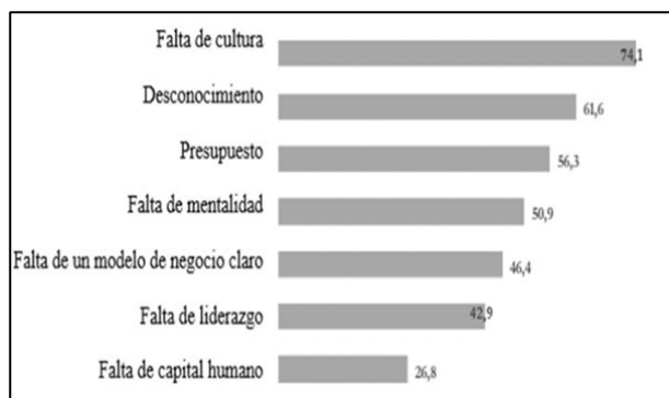
FIGURA 3. Barreras y desafíos que enfrentan las empresas y organizaciones para lograr una transformación digital exitosa