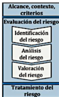
FIGURA 2. Proceso de gestión del riesgo

La identificación del contexto como primera actividad, seguida de la evaluación del riesgo que incluye: identificación, análisis y valoración del riesgo y, para finalizar con un posible tratamiento, lo cual nos dará las bases primordiales para el desarrollo del tercer objetivo específico.